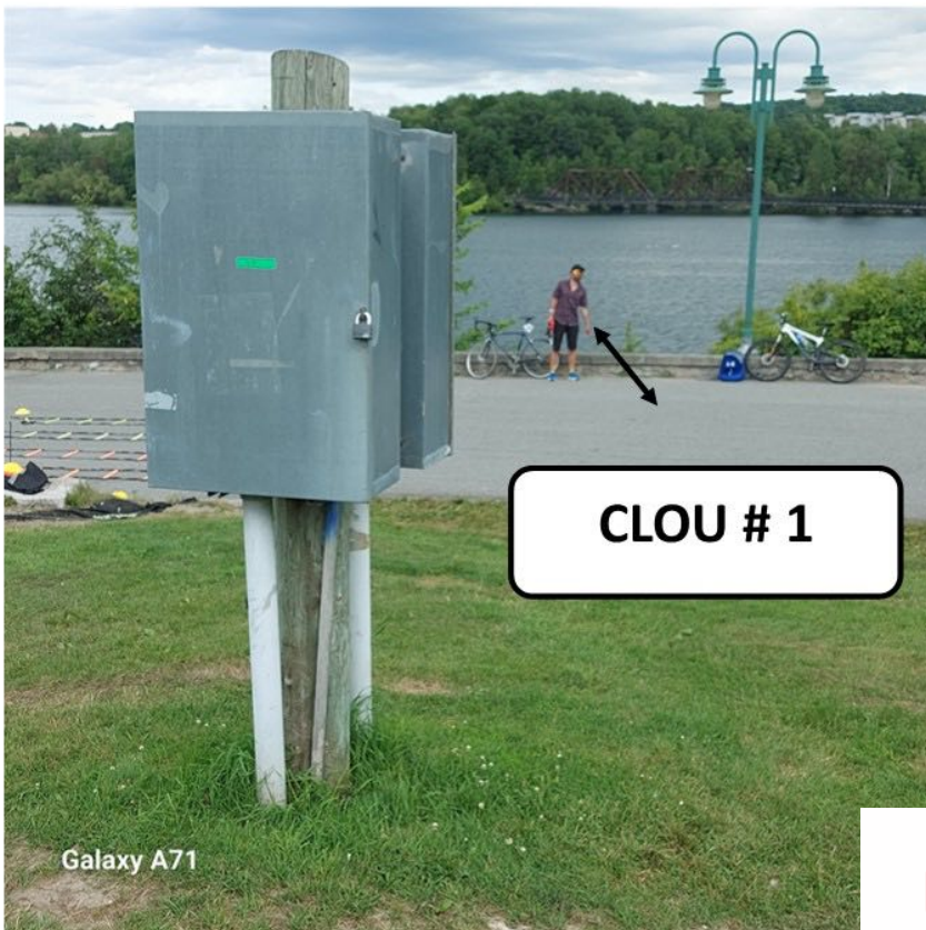
CLOU # 1