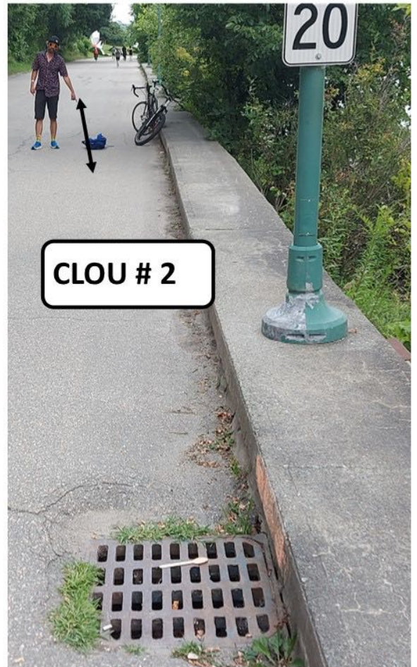
CLOU # 2